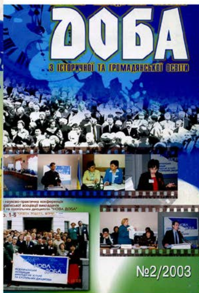
№2 2003 Червень 2003 1500 екз.