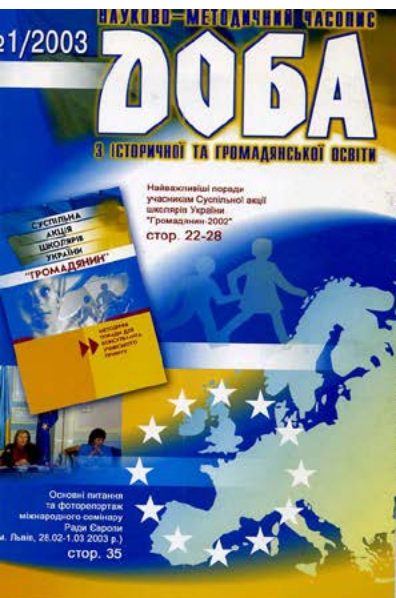
№1 2003 Лютий 2003 1500 екз.

Щоквартальник «Доба» акумулює у собі кращий вітчизняний та зарубіжний досвід у галузі викладання історії та громадянської освіти. Журнал надає надзвичайно великі можливості щодо інформування вчительської аудиторії про теоретичні засади суспільствознавчої освіти, інноваційні технології, активні методи навчання, приклади із шкільної практики тощо. Опублікований у журналі науково-методичний матеріал широко використовується у педагогічній практиці вчителів України.