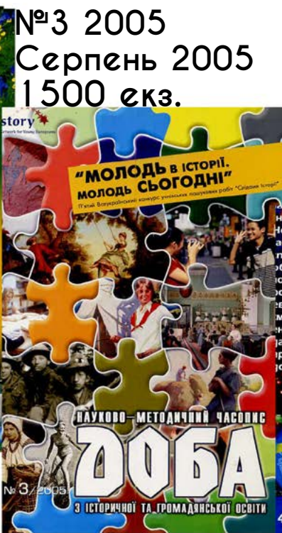
№3 2005 Серпень 2005 1500 екз.