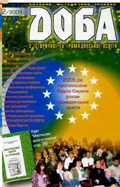
№2 2005 Червень 2005 2000 екз.