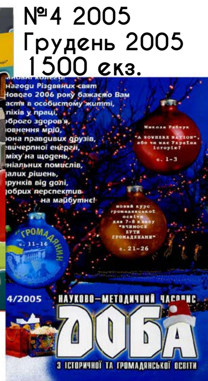
№4 2005 Грудень 2005 1500 екз.