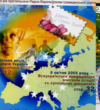
№1 2005 Лютий 2005 1500 екз.