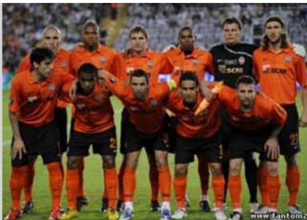
Футбольний клуб «Шахтар» — переможець Кубка УЕФА 2009