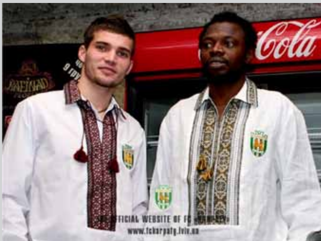
Вболівальники ФК «Карпати»

Офіційний веб-сайт ФК «Карпати» www.fckarpaty.lviv.ua