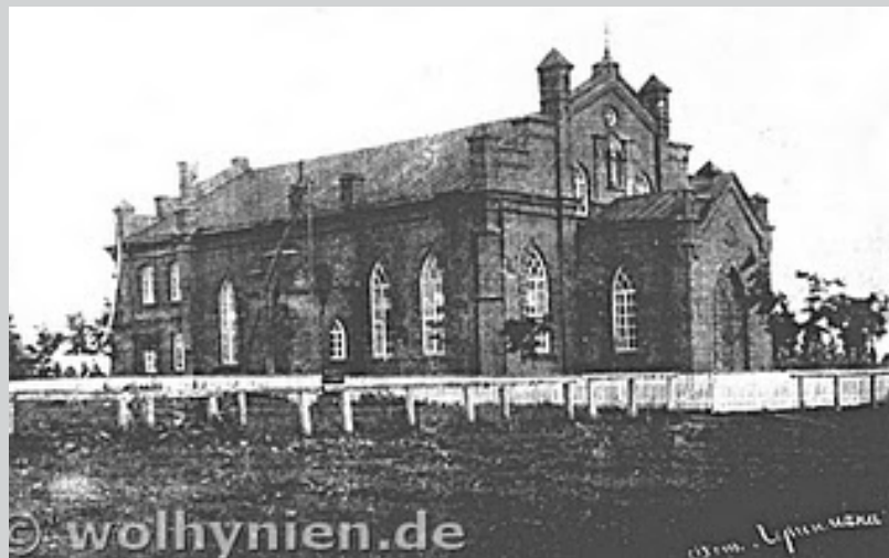
Баптістська церква у Нойдорфі (Волинь). 16 вересня 1907 року

Ревчук р. Німецька Житомирщина [Електронний ресурс] / Роман Ревчук. — Режим доступу: http://drevlyaniya.blogspot.com/2010/12/blog-post.html .